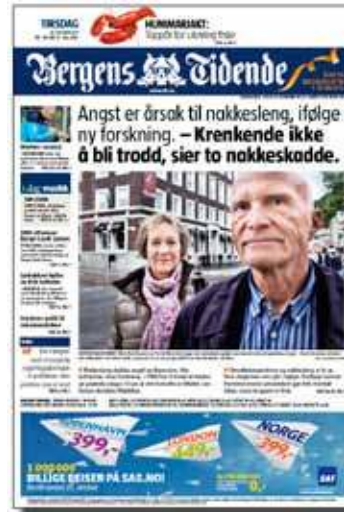
BT I GÅR: – Nakkesleng skyldes angst og depresjon, ikke kollisjon, uttalte en forsker i gårldagens BT. Nakkeskade reagerer sterkt på de nye forskningsresultatene.

–Den dagen det kommer forskning som klarer å påvise biomarkører, så vil det snu. Det vil gjøre det lettere for legene å